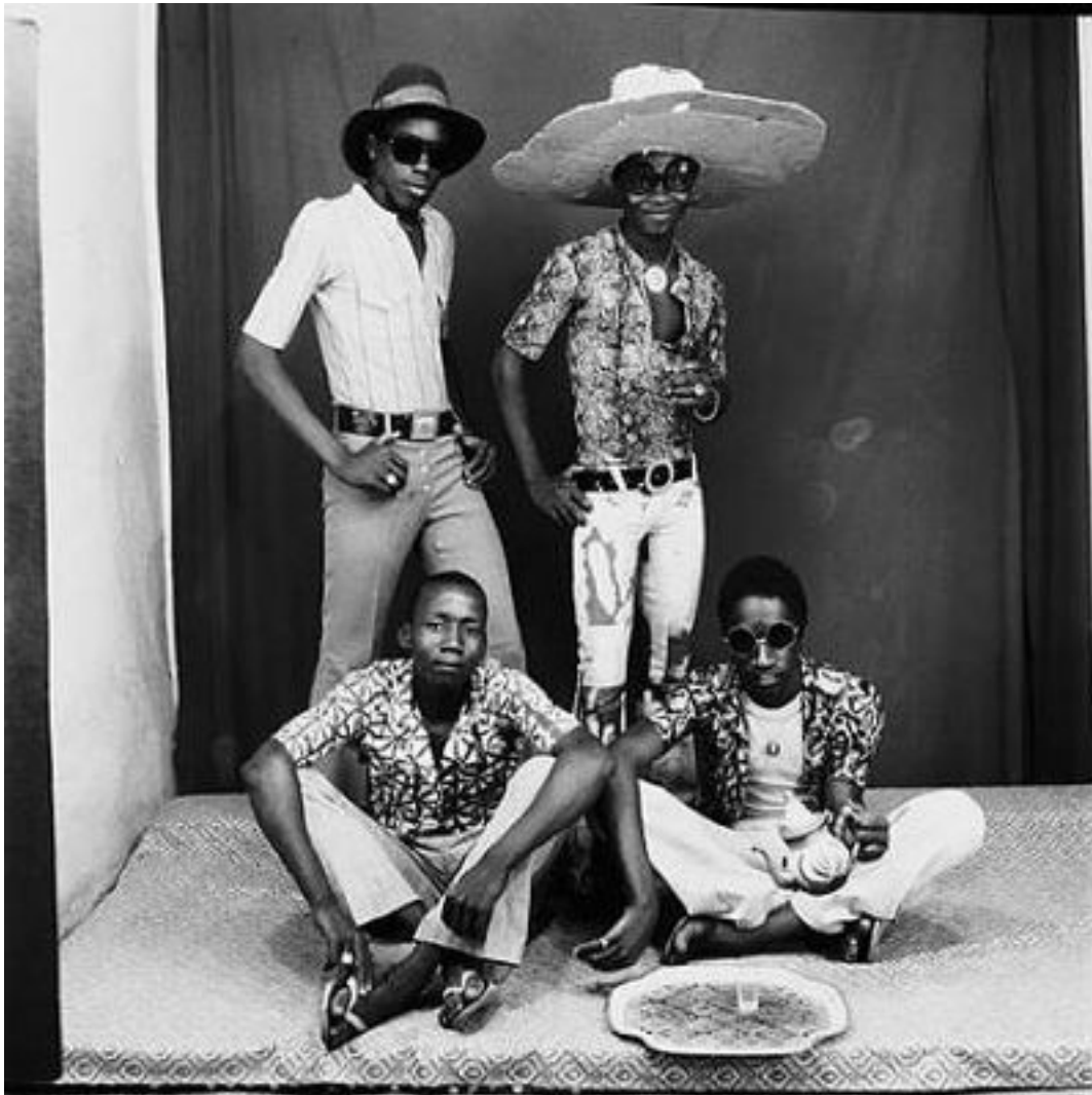
Des portraits plein d'humour aussi